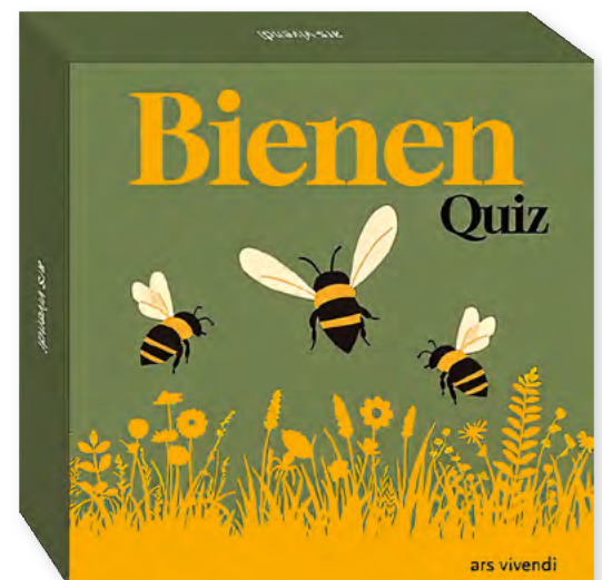
Dr. Corinna Weinert Bienen-Quiz stabile Schachtel mit 66 farbigen Karten Format: 10 x 10 x 3,2 cm € 16,95 Art.Nr. 5733

Wie gut kennen Sie die Welt der Bienen? Mit dem Bienen-Quiz für Erwachsene und naturbegeisterte Jugendliche entdecken Sie faszinierende Fakten über Bienen. 66 Quizfragen vermitteln spannendes Wissen über Imkerei, Artenvielfalt, Umweltschutz und das fragile Zusammenspiel zwischen Mensch und Natur.