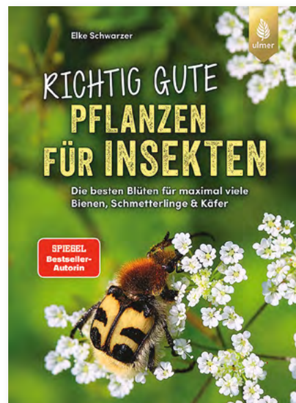
Elke Schwarzer, Richtig gute Pflanzen für Insekten Die besten Blüten für maximal viele Bienen, Schmetterlinge & Käfer Klappenbroschur, 144 Seiten 134 Farbfotos, Format: 23,5 x 17 cm € 20,00 Art.Nr. 5734

Lernen Sie rund 90 Blumen, Sträucher und Bäume kennen, die von pollen- und nektarsuchenden Blütenbesuchern angefliegen werden oder als Futterpflanze dienen.