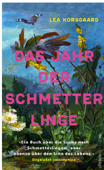
Lea Korsgaard, Das Jahr der Schmetterlinge , Hardcover mit Schutzumschlag, 336 Seiten, mit 61 farbigen Buntstiftzeichnungen der Autorin € 22,99 Art.Nr. 5735

Ihre Suche nach den Schmetterlingen führt Lea Korsgaard zu Landschaften, von deren Existenz sie nie geahnt hätte - und zu den großen philosophischen Fragen: Warum und wofür leben wir wirklich?